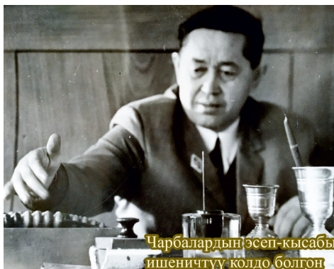
Чарбалардын эсеп-кысабы ишеничтүү колдо болгон

1953-1955-жылдары Ысык-Көл районунун Крупская жана Ленин атындагы колхоздордо башкы бухгалтер болуп иштеген. 1956-1957-жылдары Тянь-Шань облусундагы Куланак районунун Механикалык-техникалык станциясында бухгалтер, 1957-1962-жылдары Кочкор районунун Кара-Суу колхозунда башкы бухгалтер кыз-